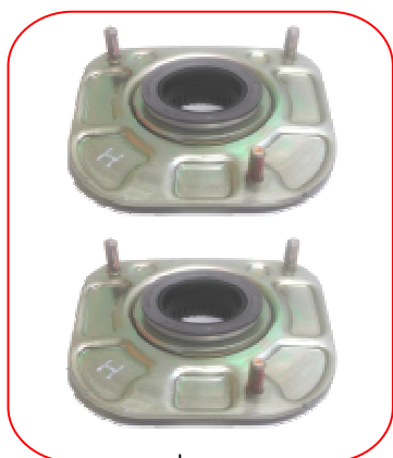
VKDC 45610 T

Az ÚJ VKDC 35634 T két felső csillapítót tartalmaz, mely biztosítja azt, hogy a felhasználó teljeskörű javítást végezhesen. Ezeknek a gumi rugóülékeknek az a feladatuk, hogy a rugók és a lengéscsillapítók által továbbított vibrációkat kiszűrjék.