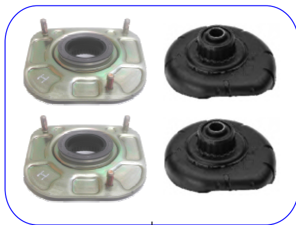
ÚJ VKDC 35634